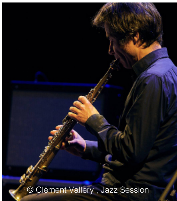
© Clément Valléry , Jazz Session

https://www.uninstantalautre.com/fr/artiste