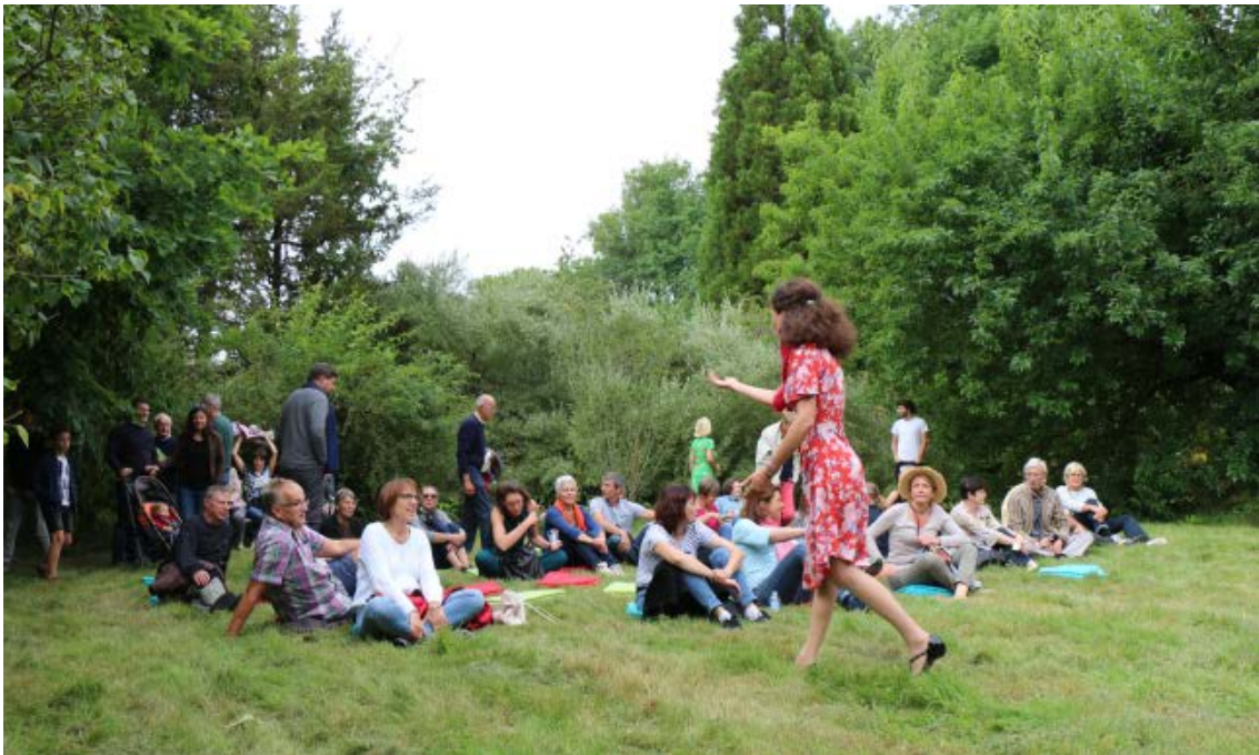
A Athie en Musique (21)