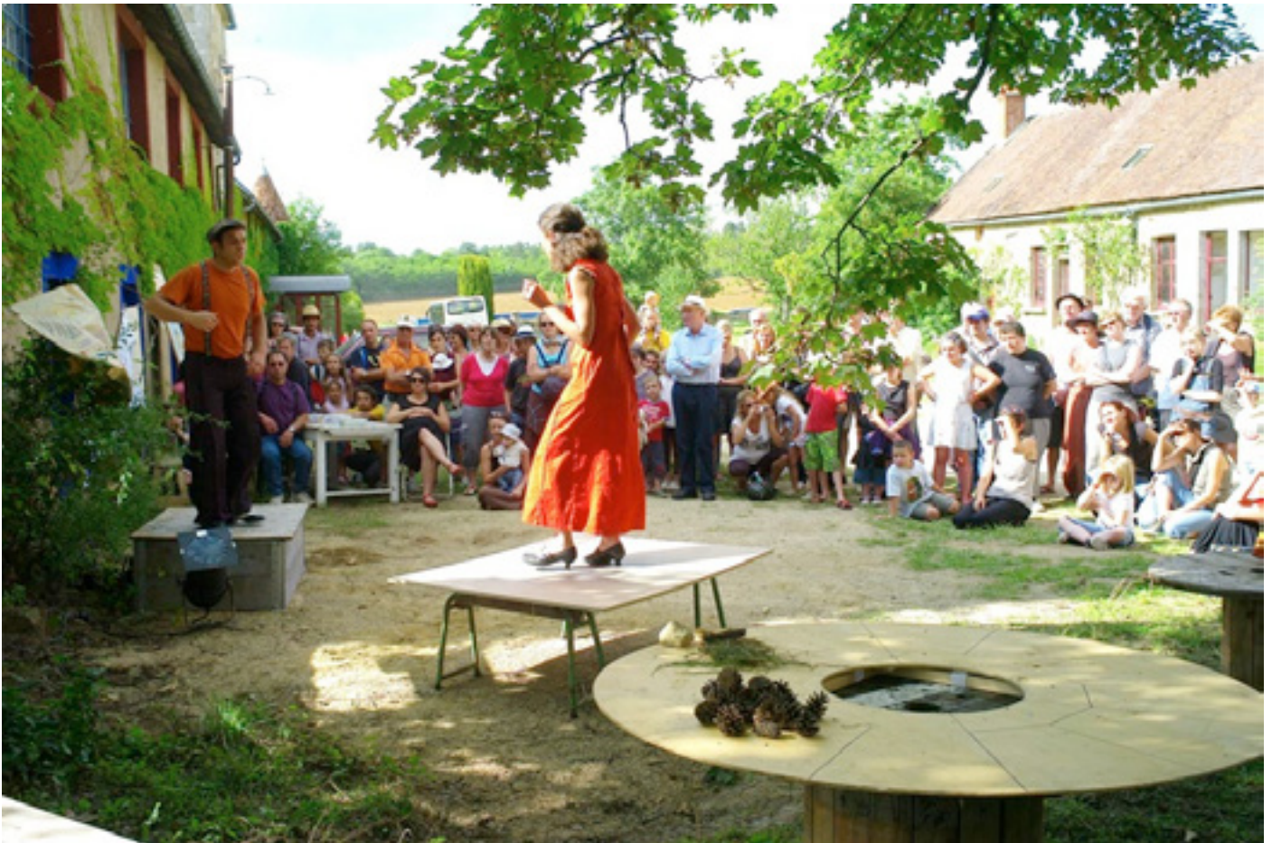
Les rencontres, château de Monthelon, aout 2010

Comme chaque pièce musicale joue sur des choix précis avec des séquences improvisées à l'intérieur de cadres propres à chaque pièce, l'espace peut être différent pour chacune des pièces, l'ensemble formant alors un parcours avec les spectateurs. Les lumières présentes sur le plateau et manipulables par les deux musiciens créent des points de vue, des angles d'approche non figés et renouvelés au grès des changements des compositions. L'ensemble est scénarisé, en intégrant des transitions, glissements et passage de relais.