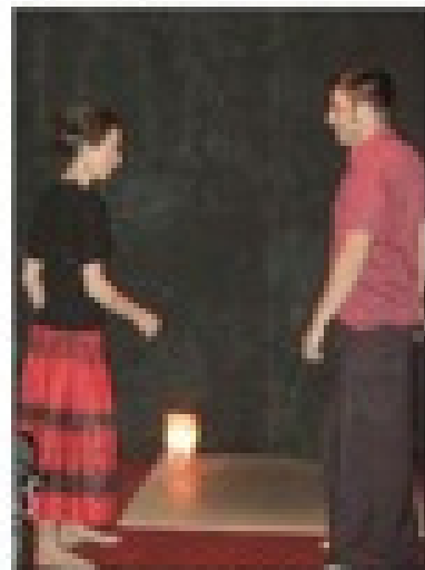
Un curieux spectacle basé sur la gestuelle et la parole imaginaire.

Depuis 2005, l'association D'un instant à l'autre a l'ambition de promouvoir la création de formes artistiques pluridisciplinaires en milieu rural. Très présente dans le territoire, elle organise un peu partout des actions pédagogiques pour un public de profes-